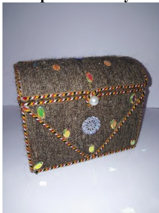
Из коробки шкатулка!