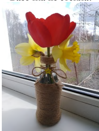
Вазочка из стекла!