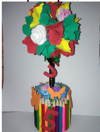
Из старых карандашей!