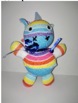
Единорожка из носка!